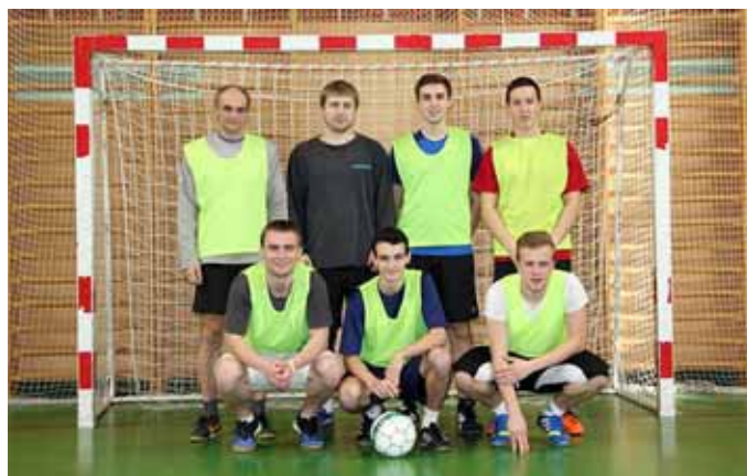
2. místo Želva Cupu tým Hluboké