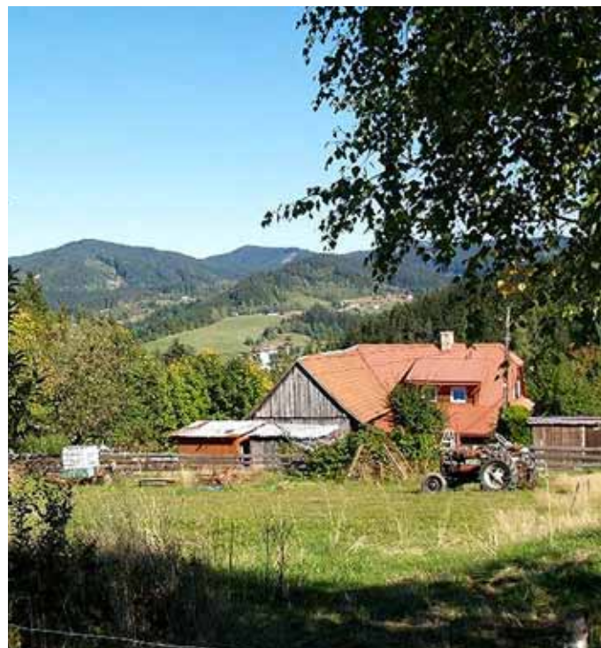
Současná podoba Kubáňova rodiště z pohledu směrem k Mečové.

Prameny: KUBÁŇ, Jan: Kouzlo Valaška. Valašská svatba na Horní Bečvě. Triton, Praha 2000; Pověsti z Horní Bečvy. Palacký, roč. 13., 19. 11. 1919, č. 43, s. 2-3; Zemský archiv Opava, matriky a pozemkové knihy Horní Bečvy.