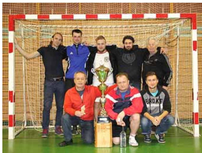
Vítězové Želva Cupu tým Mečůvka – Valaška – Lúky

Text: Martin Němec