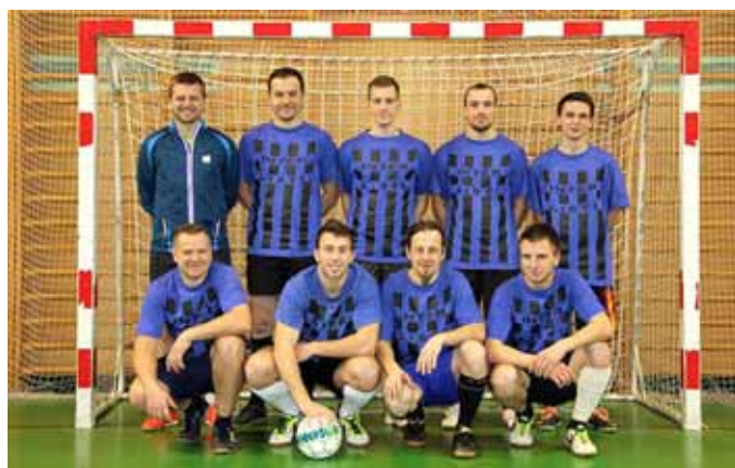
3. místo Želva Cupu tým Inter Liščí